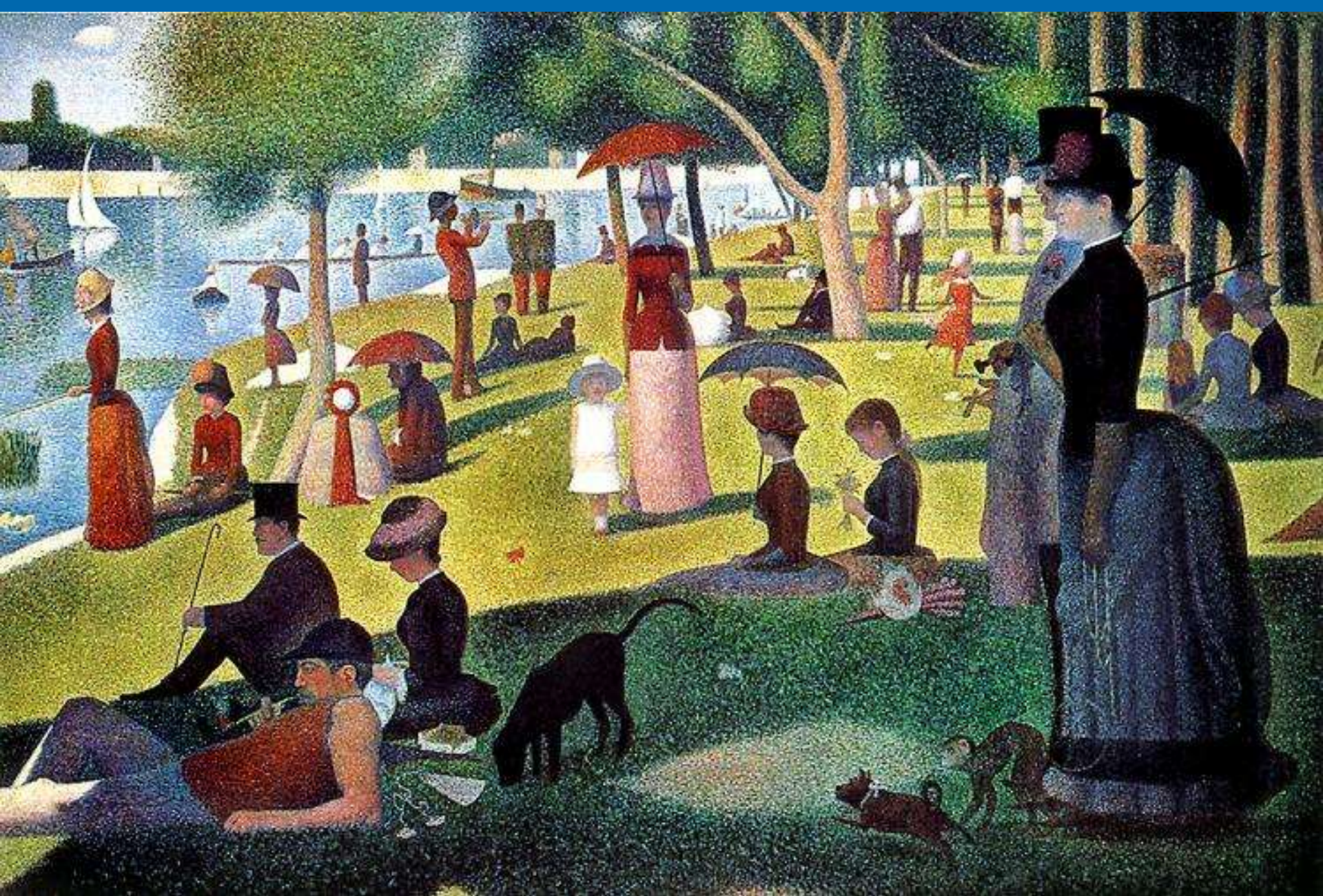
جورج سورا: الصّحيفة الكبرى La grande jatte